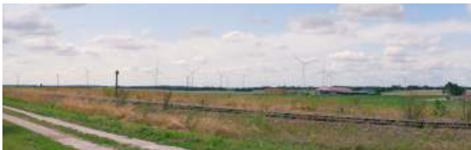
Photomontage réalisée à partir d'une prise de vue de Nuisement-sur-Coole vue face aux rails.

NORDEX France évalue la faisabilité de ces propositions et partagera l'ensemble des actions réalisables dans le cadre d'un projet éolien au cours du prochain événement de la concertation : le FORUM DE PARTAGE du mercredi 11 décembre 2019.