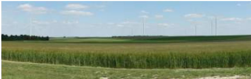
Photomontage réalisée à partir d'une prise de vue de Cheniers vue sur les champs.